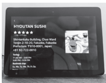
▲タッチ操作でも運用できる

「海外のPMS連携も進んできました。国内大手ホテルでは、あるホテルブランドにスマートな宿泊滞在を象徴するサービスとして全拠点・全室に採用されたほか、あらゆる宿泊客が情報にアクセス