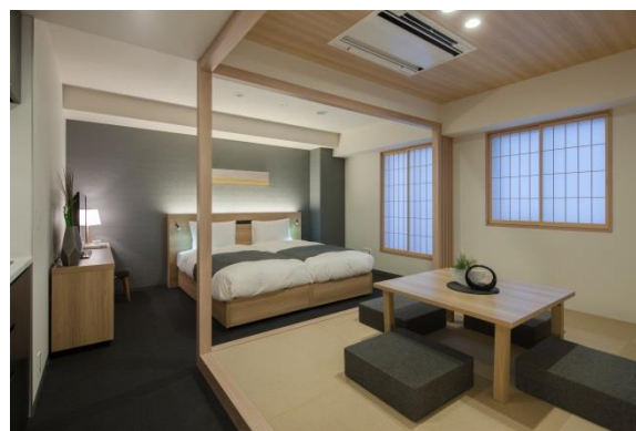
『MIMARU 东京 赤坂』客房

主页： https://mimaruhotels.com/ja-jp/akasaka/