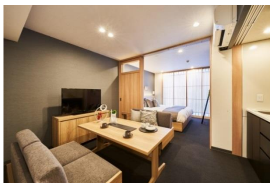
『MIMARU 京都 新町三条』客房

主页： https://mimaruhotels.com/ja-jp/shinmachi-sanjo/