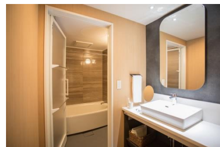
『MIMARU 东京 上野 NORT』客房